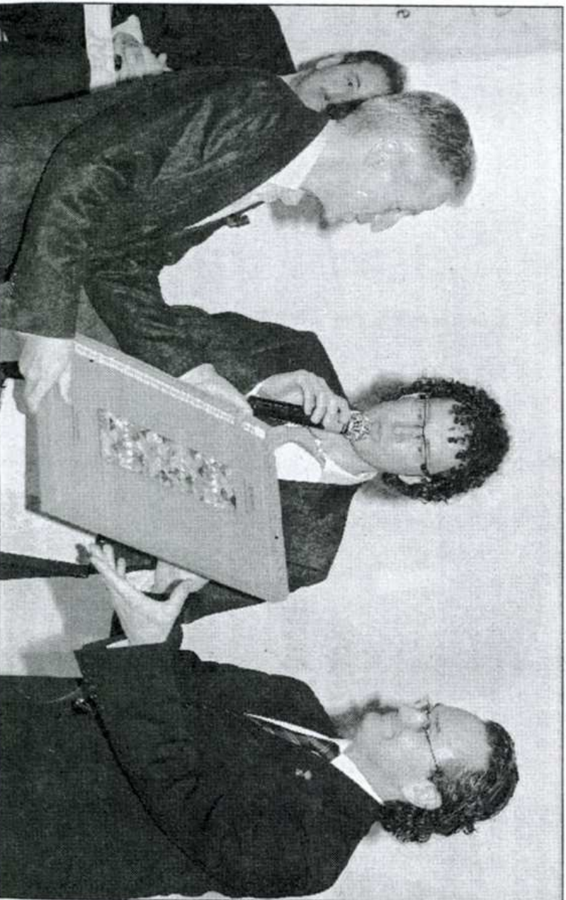
Il presidente Illy durante la premiazione dei vincitori della quarta edizione del Premio Innovazione